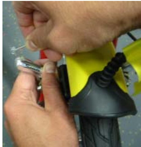
2. Cantileverbremse aushängen