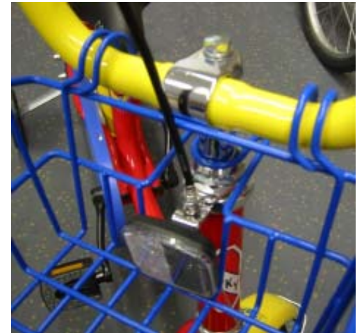
4. Zug durchfädeln (Korbmontage)