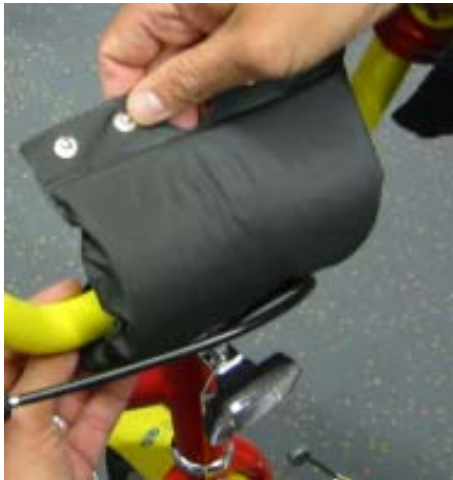
1. Lenkerposlter entfernen